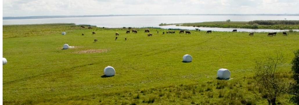
Rundbalar efter slått. Strandängarna hålls öppna för att gynna växt- och djurliv.

Nedströms Ljungsbro rinner Motala ström i sin egen fåra och nedanför kraftverket Nykvarn är den oregerad. Den här delen upplevs kanske bäst från vattnet, men det går naturligtvis också att bana sig väg genom den tät lövskogen.