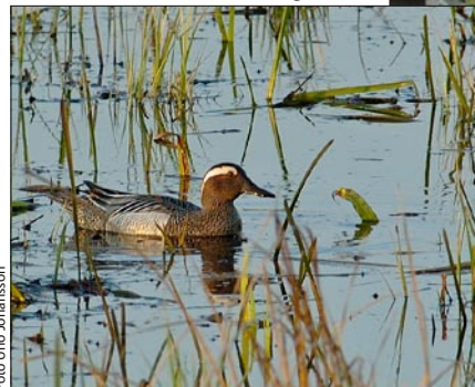
Ärta trivs i den "blå bården" mellan vass och strandäng.