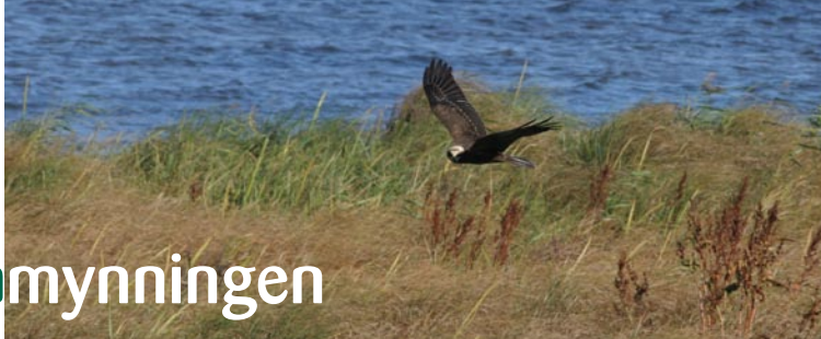
En brun kärrbökshona jagar över strandängarna.