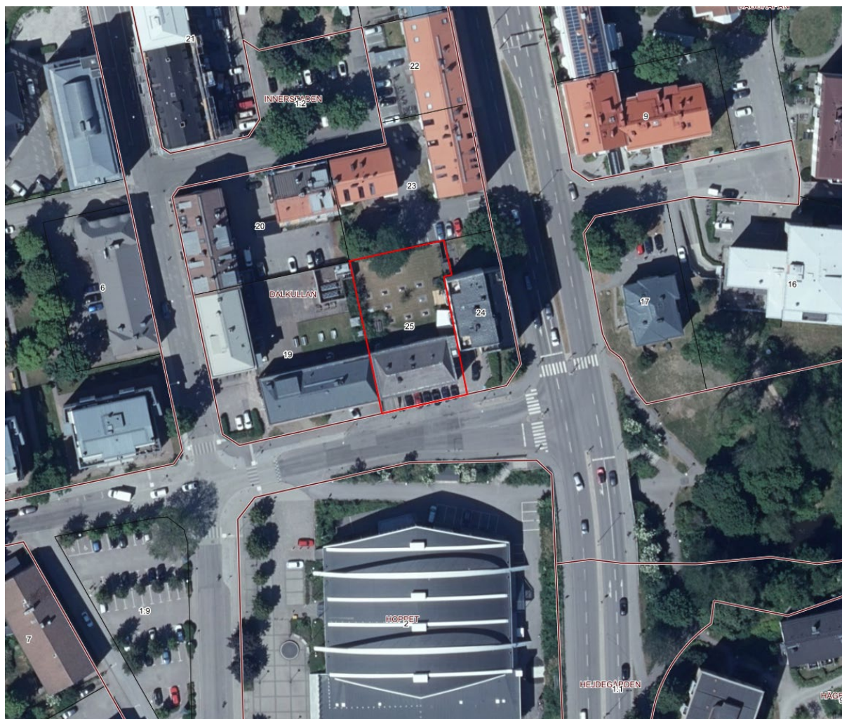
Figur 1. Planområdets avgränsning.

Preliminär avgränsning av planområdet illustreras i figur 1.