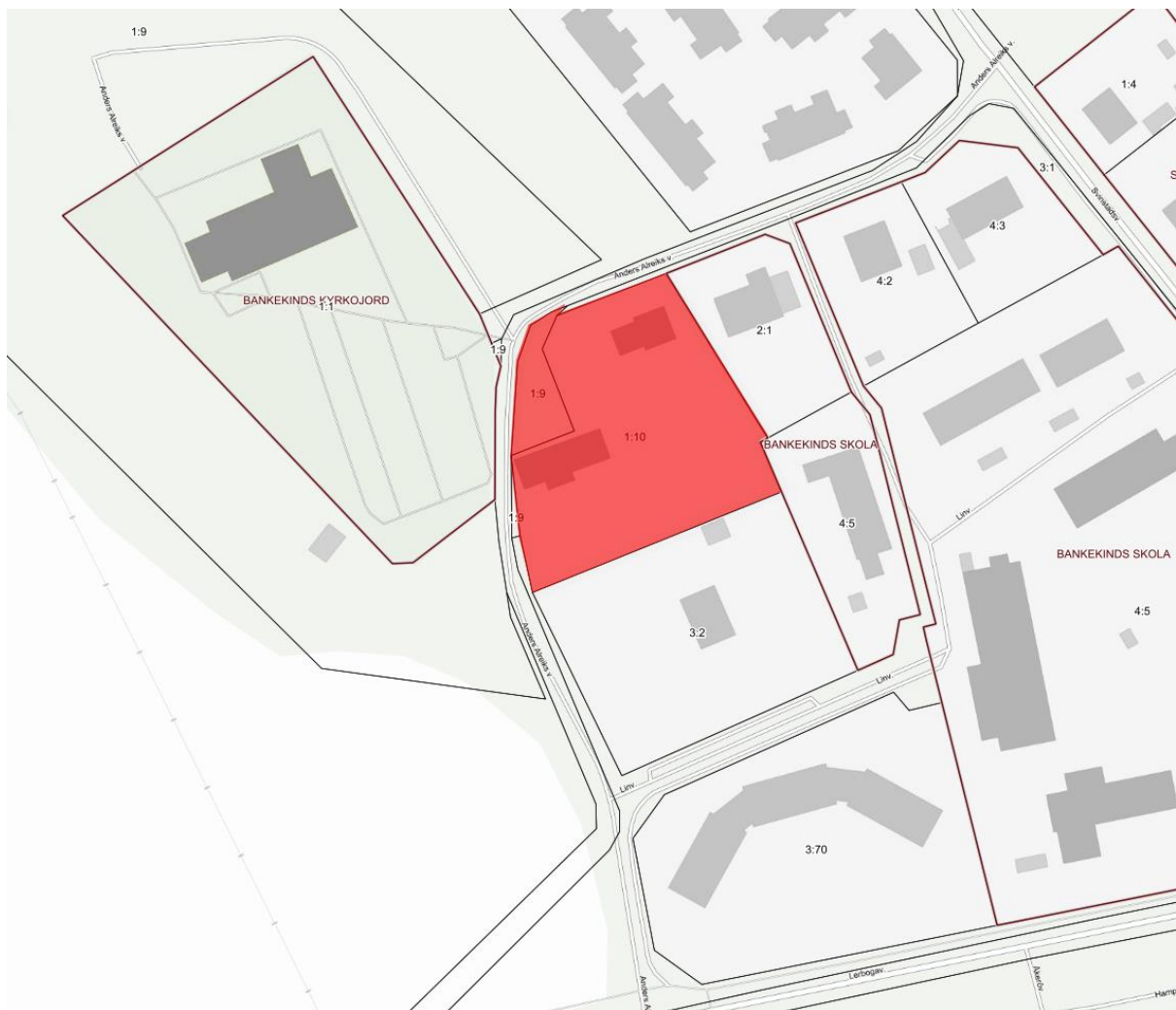
Avgränsning av planområdet.

Planområdet ligger i Bankekind ca 1,3 mil från Linköpings centrum och är cirka 0,3 ha stort. Planområdet utgörs i huvudsak av fastigheten Svinstad 1:10 som innehåller två byggnader, den tidigare sockenstugan och en administrationsbyggnad. Samtliga byggnader ska bevaras. Fastigheten angörs från Anders Alreiks väg.